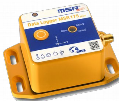
MSR 175 plus