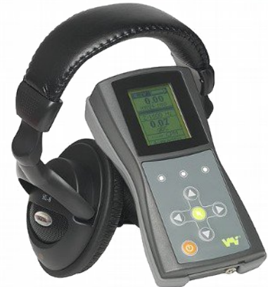
VMI Viber-X3 egycsatornás rezgés- és zajmérő, adatgyűjtő rezgés- és zajmérésre és infravörös hőmérsékletmérésre