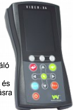
VMI Viber-X4 rezgésmérő/spektrumanalizáló és mérőutas adatgyűjtő hőmérséklet-, fordulatszám- és rezgésmérésre, egyensúlyozásra