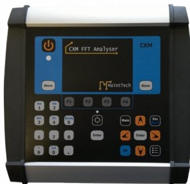
MainTech CXM kétcsatornás mérőutas rezgésadatgyűjtő spektrumelemzése, kétsíkú egyensúlyozásra