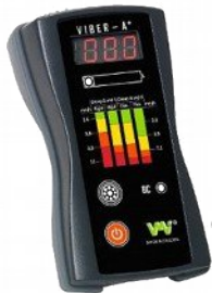
VMI Viber-A+ egycsatornás rezgésmérő gép- és csapágyrezgés mérése