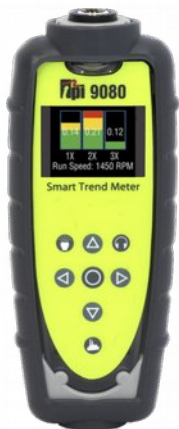
TPI STM 9080 rezgésmérő/spektrumanalizáló és mérőutas adatgyűjtő fordulatszám- és rezgésmérésre, valamint sávos rezgéselemzésre