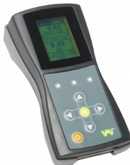
VMI Viber-X2 egycsatornás rezgésmérő szabodon állítható frekvenciatartományú gép- és csapágyrezgés mérése