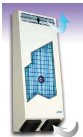
GENIUS 485J CTI