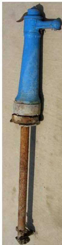
2. ábra. Korrodálódott közifolyó

A mintavételi helyek kijelölése a víziközművet üzemeltető és az ÁNTSZ feladata. A 201/2001. (X.25.) és a 47/2005. (III.11.) rendeletek csak a fogyasztási pontokon végzett vizsgálatokkal foglalkoznak, ennek ellenére az üzemeltetőnek más pontokon is kell mintáznia (lsd.: 21/2002. (IV.25.) KöViM rendelet). A hálózati betápláláshoz közeli helyen célszerű mintavételi helyet kijelölni, mivel az referencia-pont lehet a többi vizsgálathoz. Ha az innen vett minták mikroszkópos biológiaiilag kifogásoltak, akkor a hiba a víztisztítási-vízkezelési technológiában van. A mintavételi helyeket térben és időben is lehetőleg egyenletesen kell elosztani.