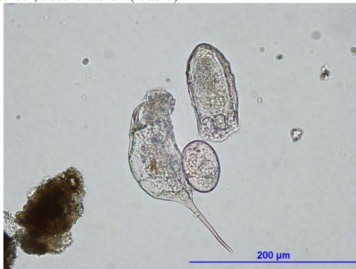
4. ábra. Keratella sp. egyed petéivel

A férgek túlélését nagy mértékben segíti, hogy petéik még a kifejlett egyedeknél is nagyobb ellenállóképességgel rendelkeznek a fertőtlenítőszerrel szemben. A mikroszkópos mintákban gyakran látni elpusztult kerekférgeket, amelyek magukon hordozzák a kikelés előtti petéiket. A peték megtapadhatnak a különböző berendezésekben, élőbevonatokon. (4. ábra).