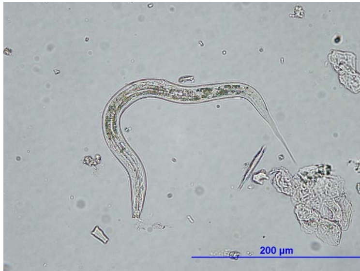
3. ábra. Nematoda sp. egyed ivóvízben

és a felsorolt tulajdonságaikból következik, hogy a fertőtlenítőszerrel szemben igen ellenállóak. A Techno-Víz Kft. 2005 évi vizsgálatai alapján a fonálférgek okozták a mikroszkópos biológiai kifogásoltság legnagyobb részét. Több minta esetében előfordult, hogy a kifogásoltságot egyszerre több szervezet (köztük a fonálférgek) okozta. Fertőtlenítés és mosatás után sokszor tapasztaltuk, hogy az ellenőrző mintában a fonálférgek még jelen voltak (igaz kisebb egyedszámmal), míg a többi szervezet eltűnt. A klór további adagolásával eltűnhettek, de ilyenkor általában a trihalometán vegyületek megemelkedett szintje miatt lett kifogásolt a minta. Vizsgálataink során olyan vízhálózattal is találkoztunk, amelynél több módszert kipróbálva sem sikerült a Nematoda-egyedszámot 5 ind./l alá csökkenteni. Ilyenkor felmerül a kérdés, hogy érdemes-e bolygatni egy stabil fonálféreg populációt, vagy időlegesen „eltüntetni” őket a hálózattól az esetlegesen határérték feletti trihalometán szint mellett?